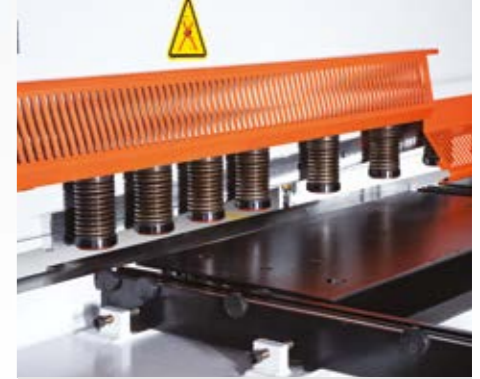
Açılabilir parmak koruma. (standart) Açılı ve çizgili kesimlerin rahat kontrolü için baskı silindirlere 1 mt.'lik ön kısmı kullanıcı isteğine bağlı olarak açılabilir. Switch korumalı.