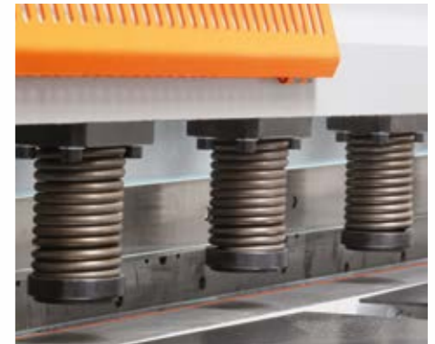
Lazer kesim çizgisi. (opsiyon) Açılı ve çizgili kesimler rahatlıkla kontrollü olarak yapılır.