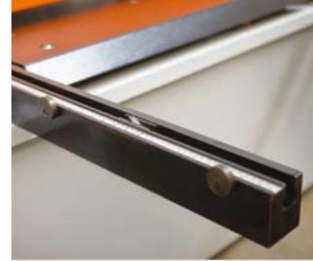
Gönyeli ön kol. (standart) Çalışmayı ve sac sürmeyi kolaylaştırır, daha hassas ve daha hızlı kesimler yapmanızı sağlar.