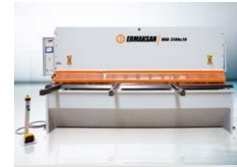
HGD SERİSİ Hidrolik Devirmeli Makas