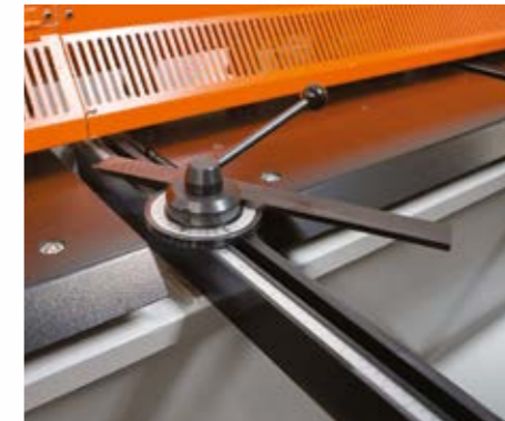
Açı ayarlı gönye. (opsiyon) Açılı kesimlerde, yüksek hassasiyetli, kolay kesim yapabilme imkanı sağlar.