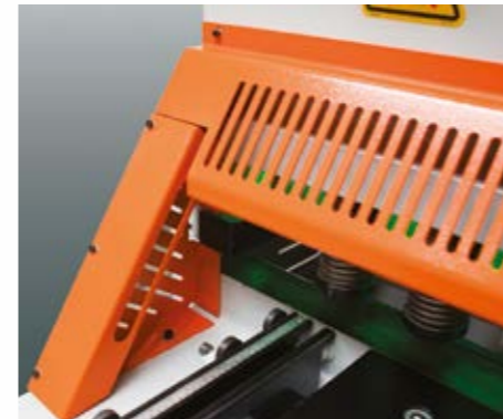
Işıklı parmak koruma. (opsiyon) Yüksek güvenlik koruması ile kolay ve hızlı çalışma imkanı sağlayan ışıklı parmak koruma sistemi.