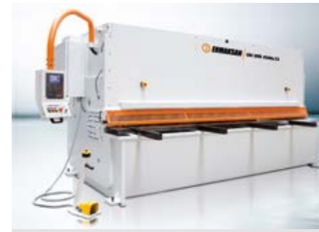
CNC HVR SERİSİ Otomatik Açık Ayarlı Hidrolik Giyotin Makas

ERMAKSAN, farklı opsiyon seçenekleri ile isteklerinizi, hızlı ve esnek çalışmaya en uygun şekilde karşılar.