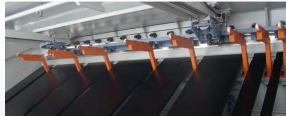
Kollu tip pnömatrik sac destek sistemi (opsiyon) Geniş ve ince sacların sarkmasını pnömatrik kollar yardımı ile önleyerek daha hassas kesimler elde edilmesini sağlayan sistemdir.