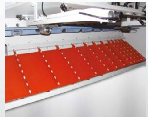
Tablali tip pnömatrik sac destek sistemi (opsiyon) Geniş ve ince sacların sarkmasını pnömatrik tabla yardımı ile önleyerek daha hassas kesimler elde edilmesini sağlayan sistemdir.