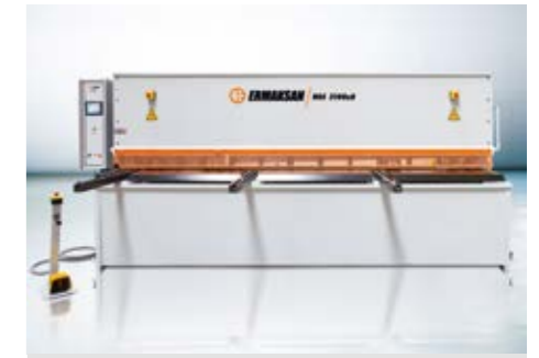
HGS SERİSİ Hidrolik Devirmeli Makas