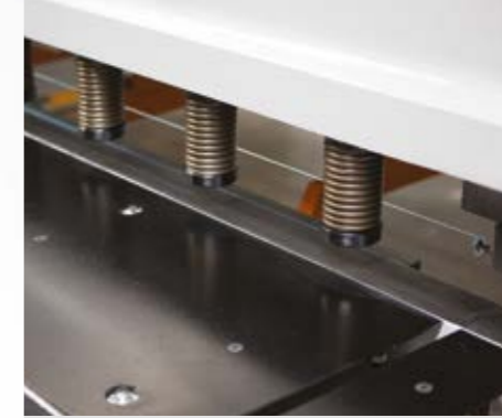
Kesim çizgisi aydınlatma gölge teli. (standart) Kesilecek sac üzerine iz düşüm oluşturarak, kaliteli ve hassas kesimler yapılmasını sağlar.